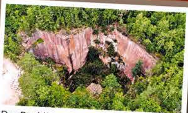
Der Rochlitzer Porphyrtuff wurde 2022 als „Welterbestein“ ausgezeichnet. Rekordverdächtig: Der Gleisbergbruch auf dem Rochlitzer Berg mit 60 m Tiefe

Über 100 Geotope gibt es im Porphyrland. 18 von ihnen sind besonders sehenswert. Drei davon sind sogar als „Nationales Geotop“ ausgezeichnet.