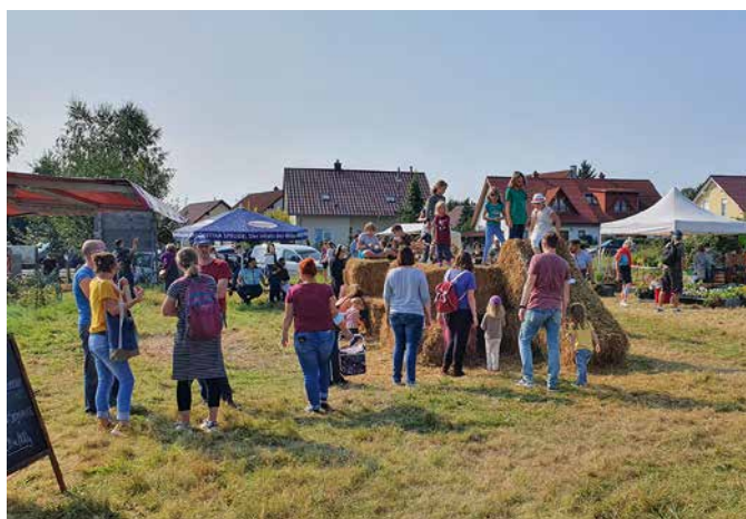
Absolut lohnenswert und für die ganze Familie etwas dabei – großes Hoffest am 14. Mai

Da es einfach zu viele wunderbare Tomaten, Chili, Paprika, etc. gibt wurde auch in diesem Jahr das Pflanzen- und Saatgutsortiment wieder erweitert. Einen Einblick in die große Auswahl bietet der neu angelegte Onlineshop. Hier kann man vorbestellen und einfach ab Hof abholen. Von Aubergine über Süßkartoffel bis hin zu Zucchini ist hier wirklich alles dabei, darunter viele alte Sorten und Raritäten. Wer sich die Pflänzchen lieber live aussucht kann den Hof in Leipzig-Liebertwolkwitz ab dem 6. April im Rahmen der Öffnungszeiten besuchen und aus dem Vollen schöpfen.