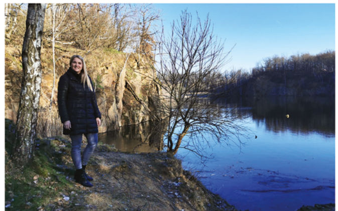
Der Haselbruch in Ammelshain ist heute ein beschauliches Naturschutzgebiet und Tauchsport-Eldorado. Weitgehend unbekannt ist, dass seine erdgeschichtliche Wiege im Supervulkanismus liegt.

Weiterführende Informationen zu den Geoportalen, Erlebnisorten im Geopark Porphyrland und weitere Angebote finden Sie online im Internet unter: